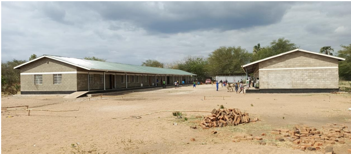
Figuur 2: Schoolgebouwen Resultaat (8 klaslokalen en 4 lerarenhuizen)