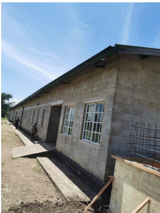
Figuur 13: Goten en Wateropvang Klaslokalen Bolera