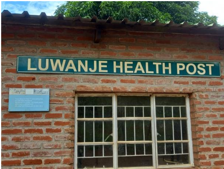
Figuur 9: Onderhoud Mulanje Gezondheidspost