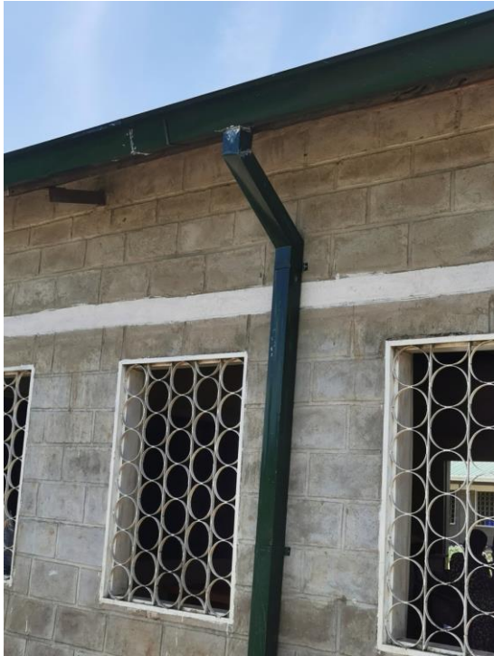
Figuur 14: Dakgoten Klaslokalen Bolera