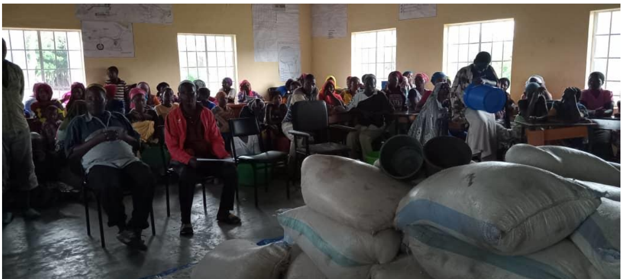
Figuur 5: Noodhulp mais 80 families