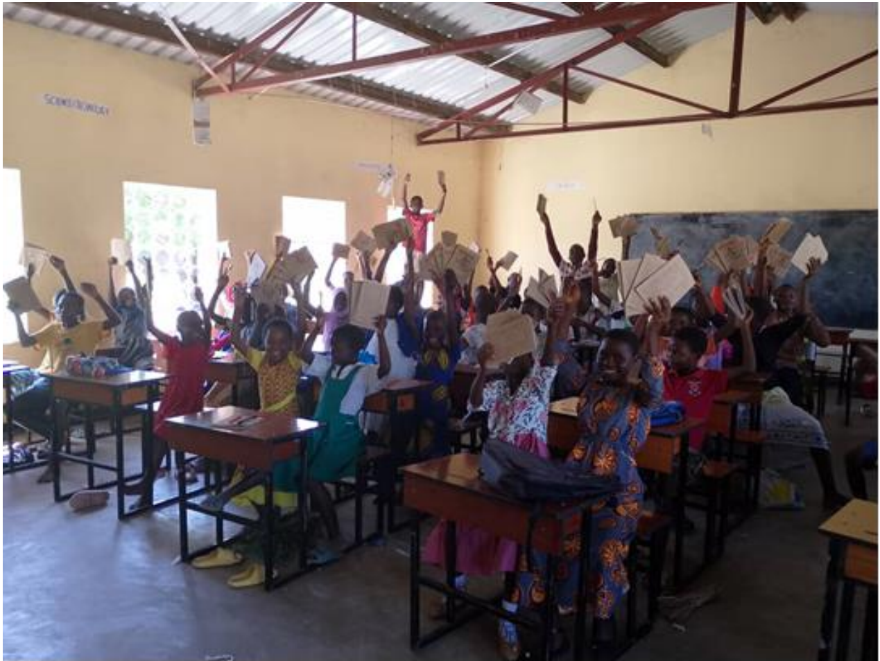
Figuur 8: Schrijfmateriaal