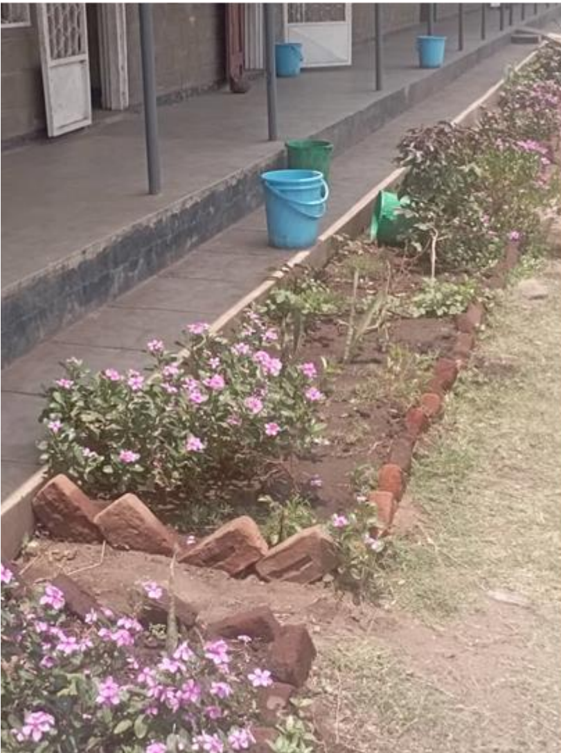
Figuur 7: Tuin aanleg school