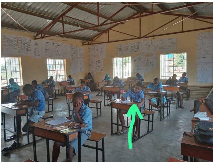
Figuur 3: Lessen groep 8 (Toetsen afnemen)