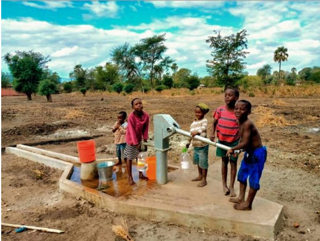
Figuur 12: Gerenoveerde Waterpomp Regio Mangochi