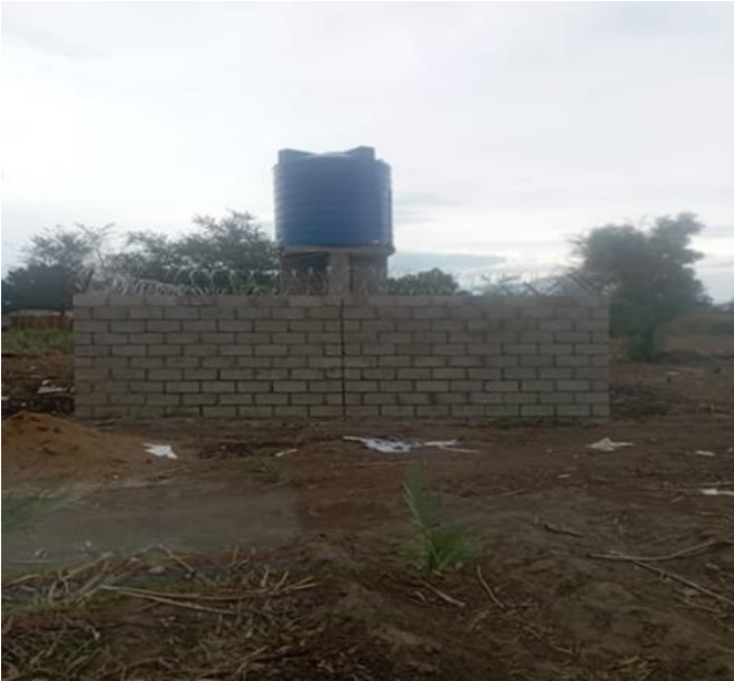
Figuur 6: Garden Pump Fence