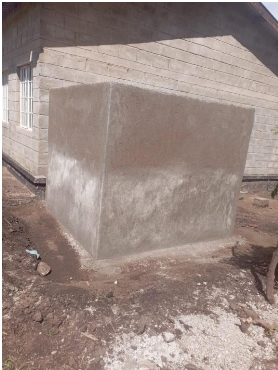
Figuur 15: Betonnen Bak Wateropvang Klaslokalen