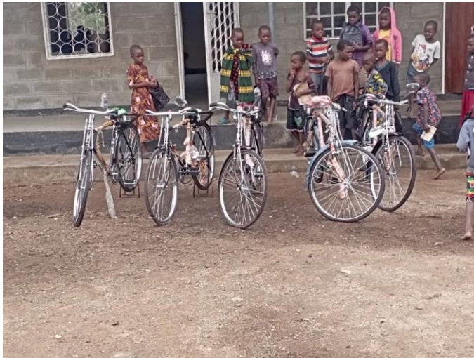
Figuur 4: Fietsen voor 5 leerkrachten