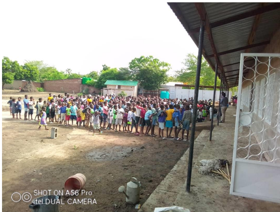
Figuur 21: Eerste lesdag