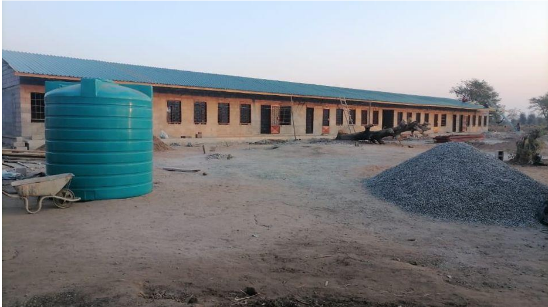
Figuur 6: Klaslokalen in aanbouw