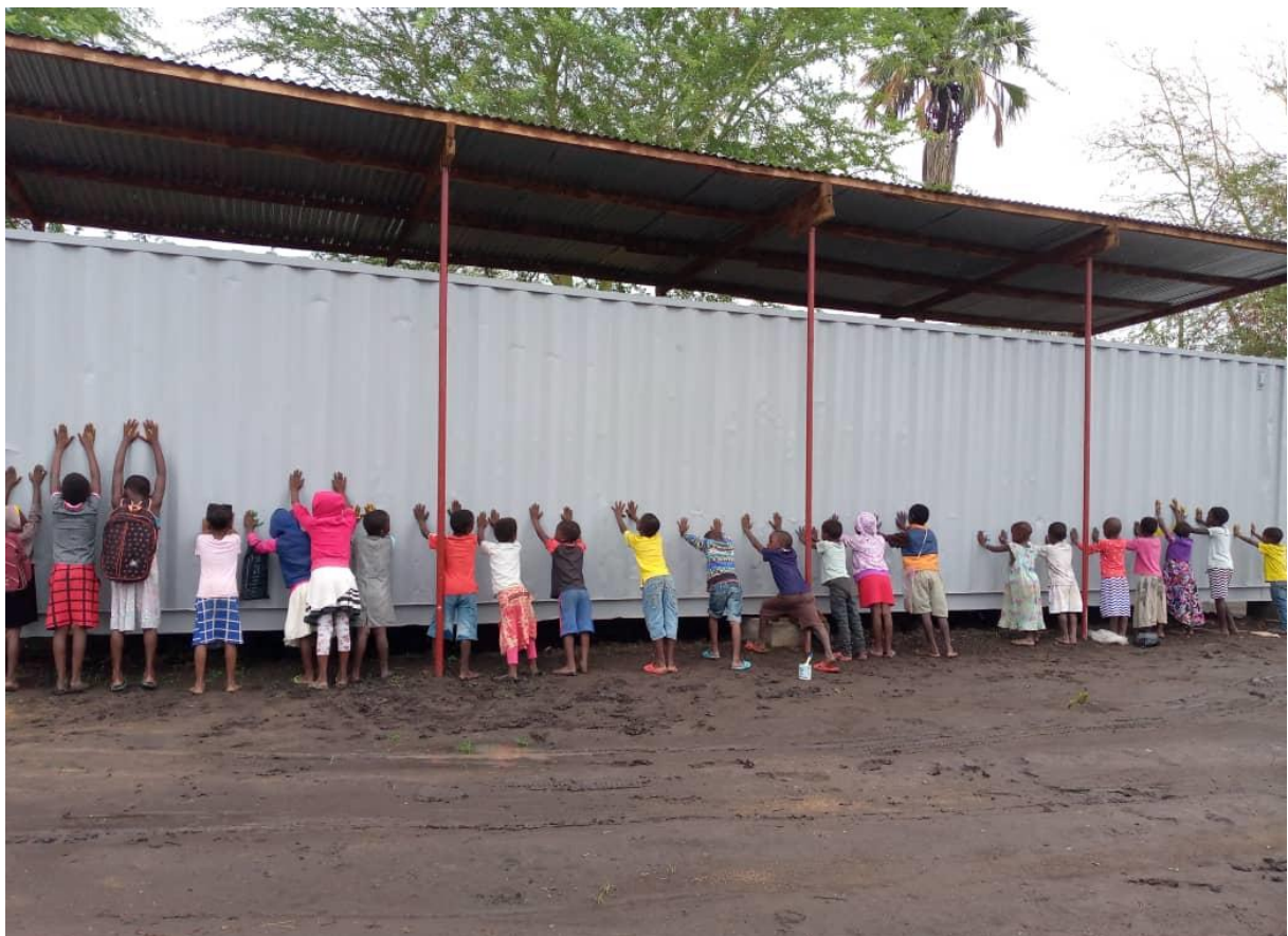
Figuur 4: Vingerverven kinderen container