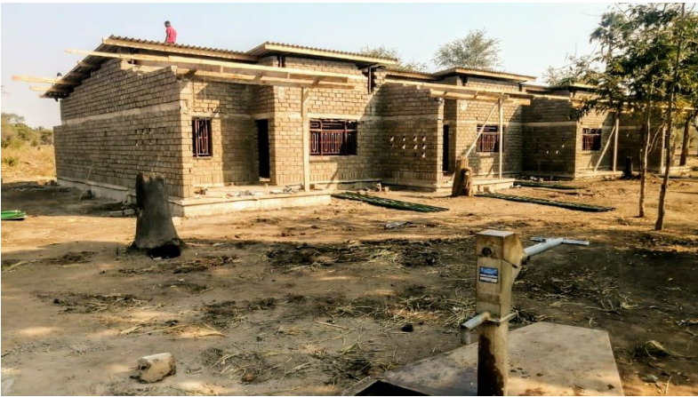
Figuur 12: Lerarenhuizen in aanbouw