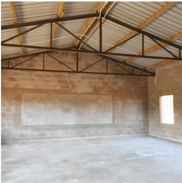
Figuur 8: Binnenkant school