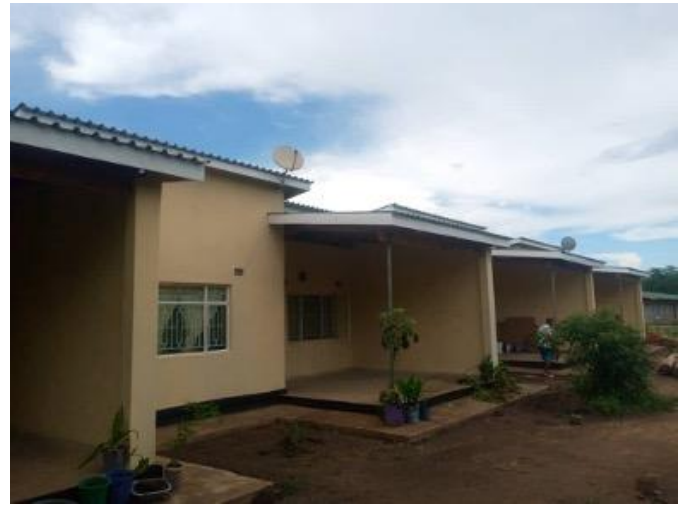
Figuur 13: Lerarenhuizen