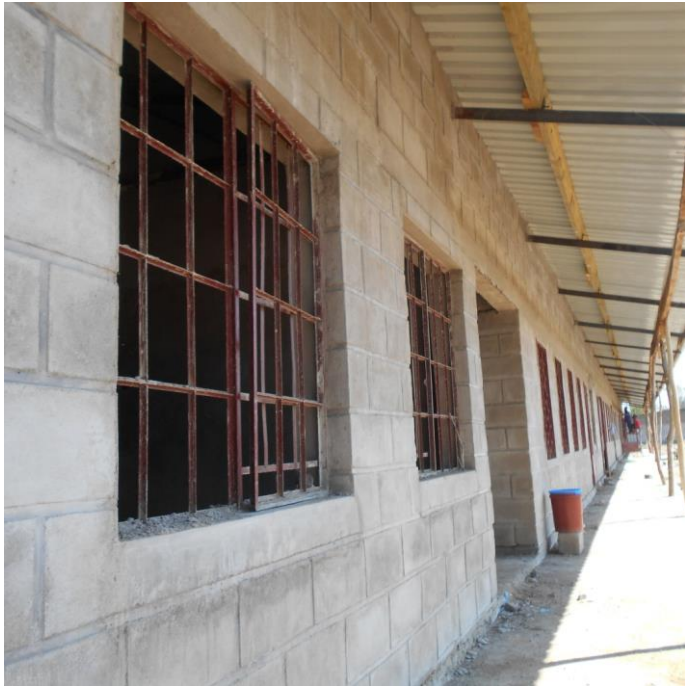
Figuur 9: School buitenkant