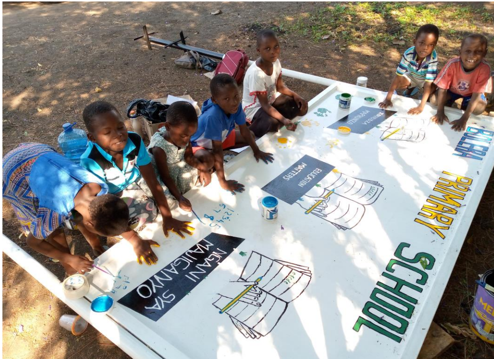
Figuur 3: Promotiebord Bolera