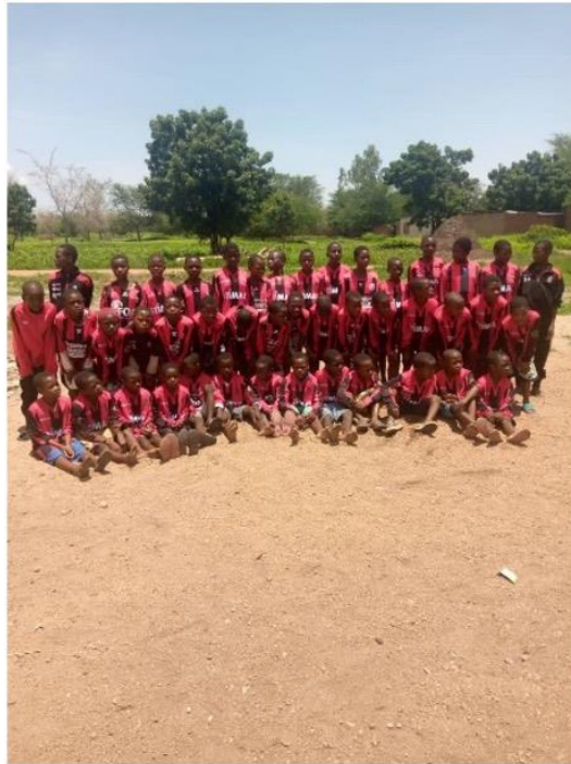
Figuur 16: Voetbalelftal FC Bolera