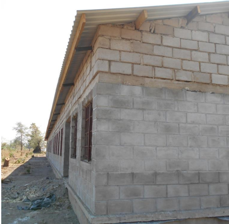
Figuur 11: School buitenkant casco bouw