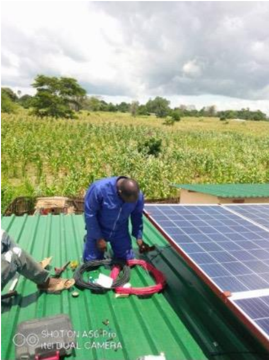
Figuur 15: Zonnepanelen