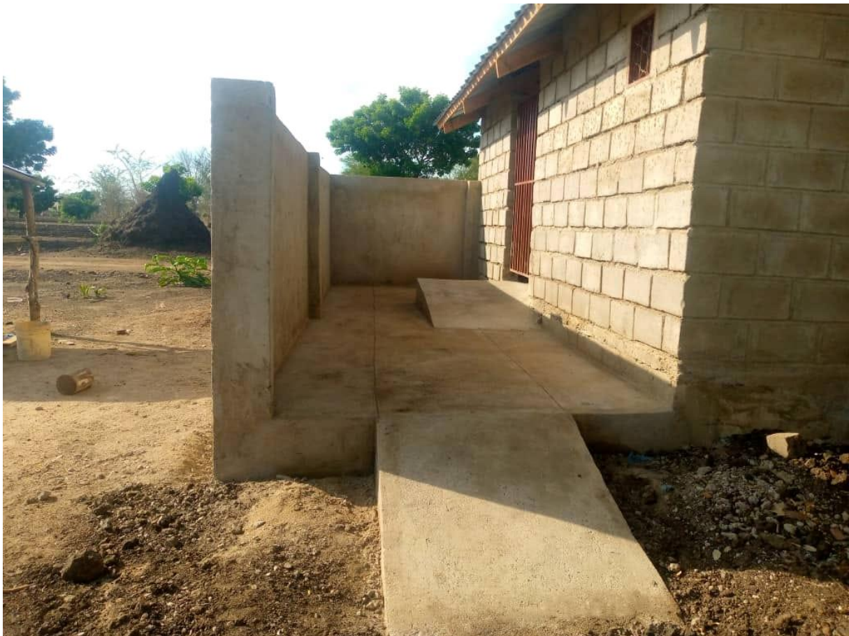
Figuur 7: Toiletgebouwen