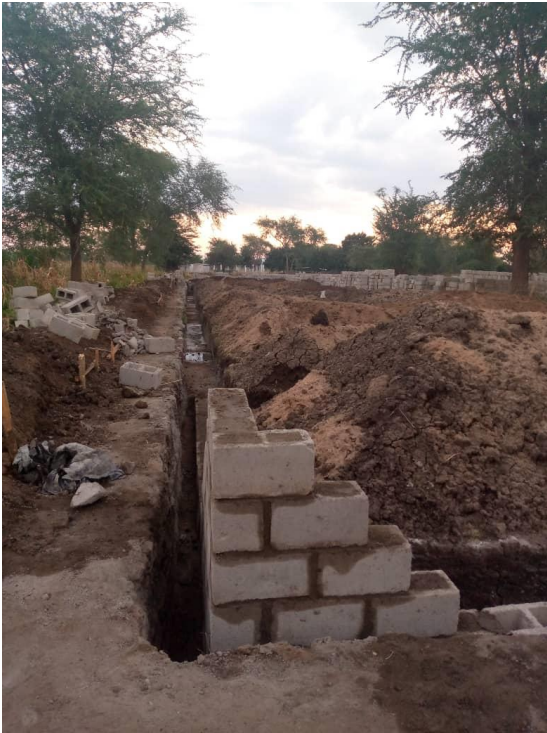
Figuur 5: Eerste hoekstenen geplaatst:

“So, you are no longer strangers or guests, but citizens, like the saints and members of the household of God, built on the foundation of the apostles and prophets, with Christ Jesus Himself as the cornerstone” Ephesians 2:19-20.