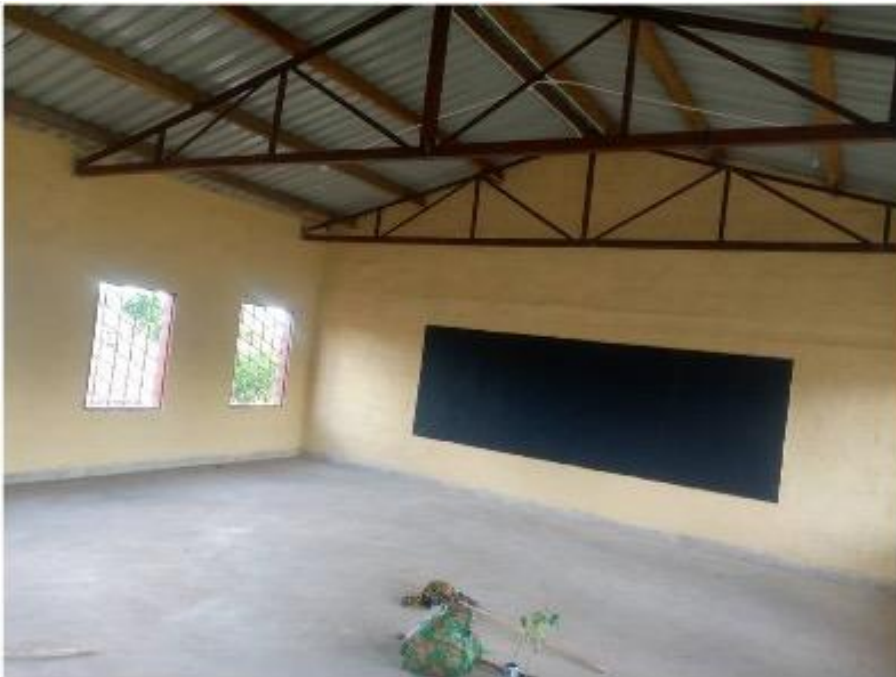
Figuur 18: Klaslokalen geschilderd