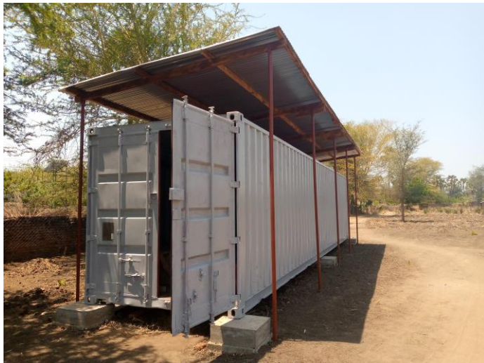
Figuur 1: Container opslag bouw school