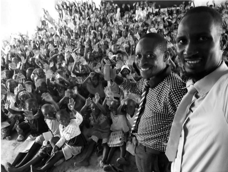
Figuur 17: Kinderen maken gebruik van de school