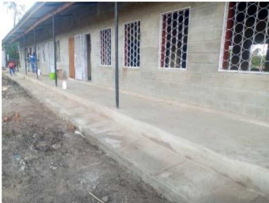
Figuur 14: Klaslokalen