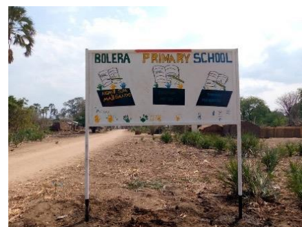
Figuur 2: Promotiebord van de school