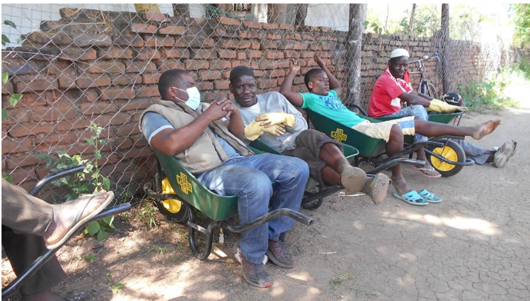
Figuur 10: bouwlieden die even relaxen